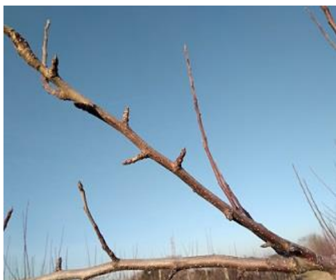
Formazioni fruttifere di melo

Insieme alla potatura, si possono effettuare anche altre operazioni complementari. Sono così definite perché completano e integrano la potatura stessa comprendono la piegatura e la curvatura dei rami, la cimatura, il diradamento delle gemme, ecc.