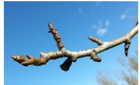
Formazioni fruttifere delle pomacee

POMACEE (melo e pero): le formazioni fruttifere preferenziali sono rami di due o più anni detti lamburde e in misura minore i brindilli (rametti di un anno di età, sottili e allungati con all'apice una gemma mista). Con la potatura va effettuato il solo diradamento di queste porzioni al fine di stabilizzare nel tempo la produttività, limitare l'alternanza di produzione, in particolar modo nel melo e regolarizzare la pezzatura dei frutti.