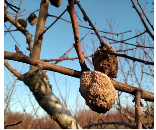
Frutti mummificati colpiti da Monilia

Nel caso ci fossero piante colpite da fitoplasmi, batteriosi o altre malattie infettive, trasmissibili con forbici e/o seghetti, si consiglia di estirpare l'intera pianta per evitarne la diffusione, in alternativa queste vanno potate per ultime. Si consiglia comunque di disinfettare gli attrezzi di lavoro con frequenza. (es con Sali quaternari d'ammonio). Per limitare il rischio di ingresso di patogeni