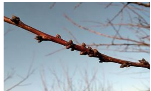
Formazioni fruttifere di albicocco

Sul susino nelle cultivar più produttive (europee, ed alcune cino-giapponesi) è possibile effettuare una potatura più energica mentre per quelle meno produttive (la maggior parte delle cino-giapponesi) si consiglia di limitare l'asportazione dei succhioni, dei rami di un anno in esubero e di effettuare un diradamento dei rami misti in eccesso.