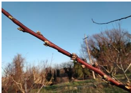
Rami fruttiferi di pesco

DRUPACEE (pesco, albicocco, ciliegio e susino): in queste specie in genere i frutti migliori si ottengono dai rami misti che possono anche essere spuntati; va evitato l'eccessivo sviluppo vegetativo nella parte alta della pianta per limitare l'ombreggiamento dei frutti; nel pesco la potatura è strettamente legata alla cultivar, in genere è comunque particolarmente energica, va poi solitamente completata con la potatura verde durante la stagione estiva.