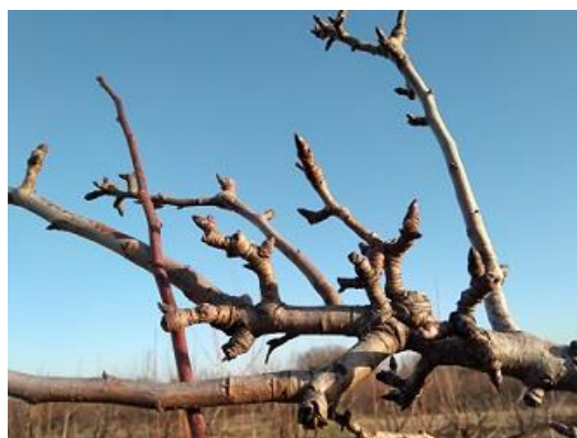
Formazioni fruttifere di pero