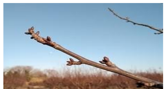
Formazioni fruttifere di ciliegio