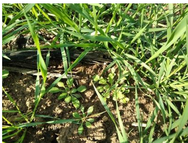
Infestanti su frumento duro