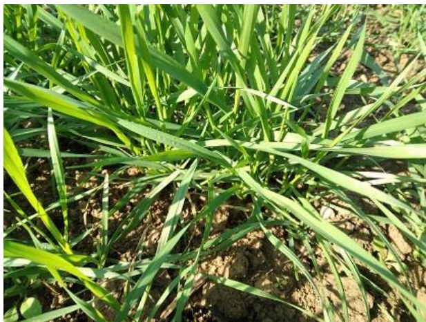
Frumento duro: fine accestimento BBCH 24

Si ricorda inoltre che nelle aziende ricadenti in Zona Vulnerabilità Nitrati non è possibile effettuare la concimazione fino al 31 gennaio, a partire dal mese di febbraio sarà redatto l'apposito bollettino nitrati con riportati i giorni in cui è possibile entrare in campo per effettuare la concimazione.