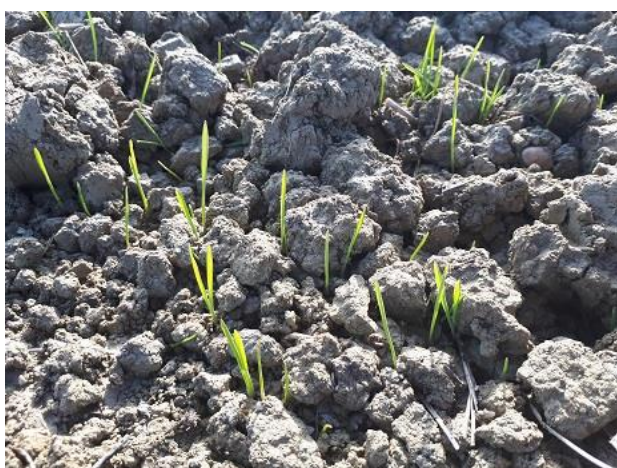
Frumento duro: emergenza BBCH 10