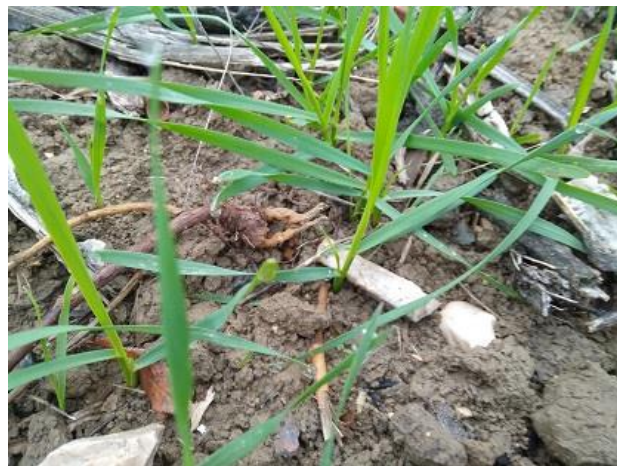
Frumento duro: inizio accestimento BBCH 21