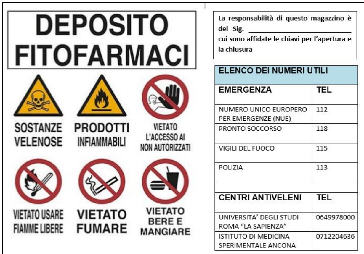
Figura 1 – Le indicazioni e i pittogrammi da apporre all'ingresso del locale adibito a deposito fitofarmaci

6. Il deposito dei prodotti fitosanitari deve consentire di poter raccogliere eventuali sversamenti accidentali senza rischio di contaminazione per l'ambiente. Il locale deve disporre di sistemi di contenimento in modo che in caso di sversamenti accidentali sia possibile impedire che il prodotto fitosanitario, le acque di lavaggio o i rifiuti di prodotti fitosanitari possano contaminare l'ambiente, le acque o la rete fognaria.