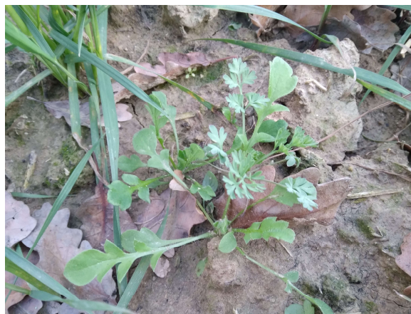
Infestanti su grano duro già sviluppate

Nelle tabelle che seguono si riportano le sostanze attive presenti nelle: "Linee Guida per la Produzione Integrata delle colture, Difesa Fitosanitaria e Controllo delle Infestanti" della Regione Marche 2021021 http://www.meteo.marche.it/news/2021/LineeGuidaPI_2021_estiva.pdf . (Ultima versione approvata). E' in fase di redazione la versione per il 2022 appena approvata verranno pubblicati gli aggiornamenti.