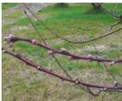
Rami fruttiferi di pesco

DRUPACEE (pesco, albicocco, ciliegio e susino): in queste specie in genere i frutti migliori si ottengono dai rami misti che possono anche essere spuntati; va evitato l'eccessivo sviluppo vegetativo nella parte alta della pianta per limitare l'ombreggiamento dei frutti; nel pesco la potatura è strettamente legata alla cultivar, in genere è comunque particolarmente energica, va poi solitamente completata con la potatura verde durante la stagione estiva.