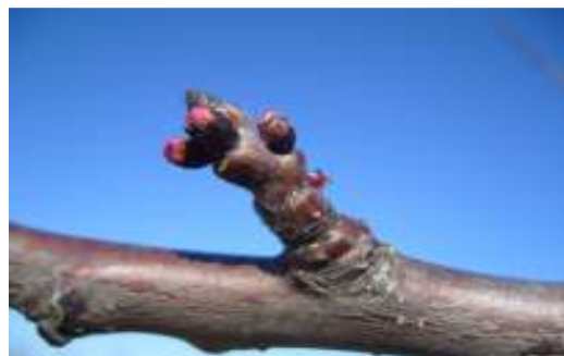
Formazioni fruttifere di albicocco

Sul susino nelle cultivar più produttive (europee, ed alcune cino-giapponesi) è possibile effettuare una potatura più energica mentre per quelle meno produttive (la maggior parte delle cino-giapponesi) si consiglia di limitare l'asportazione dei succhioni, dei rami di un anno in esubero e di effettuare un diradamento dei rami misti in eccesso.