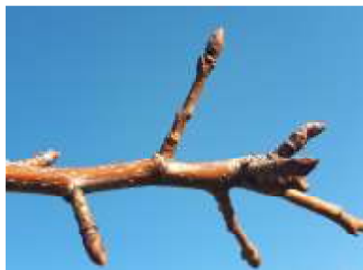
Pomacee (pero) gemma dormiente BBCH 00