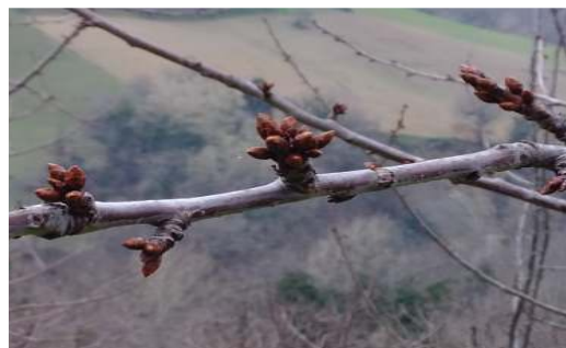
Formazioni fruttifere di ciliegio

Insieme alla potatura, si possono effettuare anche altre operazioni complementari. Sono così definite perché completano e integrano la potatura stessa e comprendono la piegatura e la curvatura dei rami, la cimatura, il diradamento delle gemme, ecc.