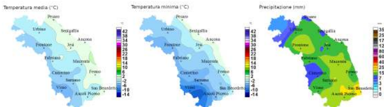
Figura 1. Mappe temperatura media (°C), temperatura minima (°C) e precipitazione totale (mm) del giorno 13 febbraio.