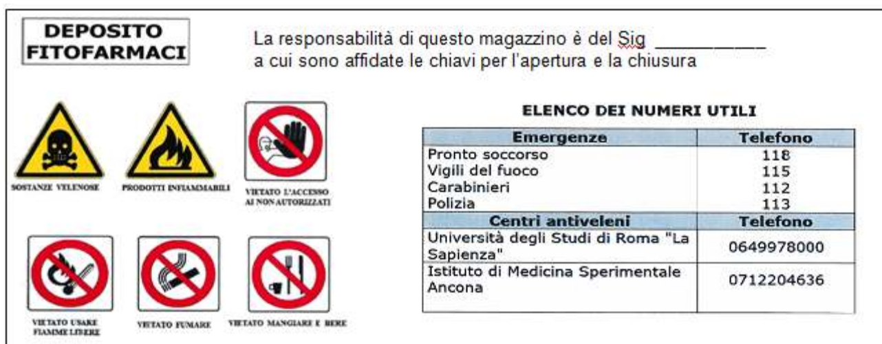
Figura 1 – Le indicazioni e i pittogrammi da apporre all'ingresso del locale adibito a deposito fitofarmaci