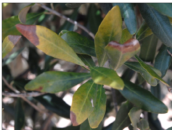
Figura 3 Sintomi su foglia