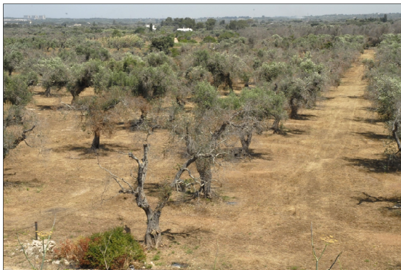
Figura 1 Olivi colpiti da Xylella

e poi le branche o l'intera pianta con imbrunimenti interni del legno a vari livelli: nei rami più giovani, nelle branche e nel fusto.