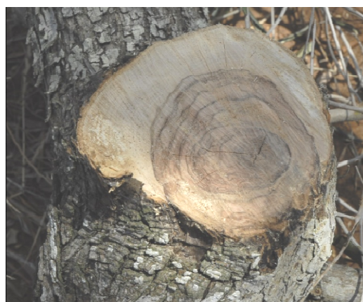
Figura 4 Sintomi su legno