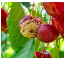
Monilia su ciliegio

Dal controllo delle trappole della rete continua ad essere rilevata la presenza, ancora molto limitata di Mosca delle ciliegie ( Ragholetis cerasi ); dalla verifica dei campioni di ciliegie in invaiatura/maturazione si rileva la presenza anche di Moscerino dei piccoli frutti ( Drosophila suzuki ). Si raccomanda quindi di eseguire la lotta a questi fitofagi seguendo le indicazioni riportate nel precedente Notiziario 18/2026 . Nella scelta dei principi attivi da utilizzare si raccomanda di dare priorità a quelli che hanno attività per entrambi i ditteri, con particolare attenzione al rispetto dei tempi di carenza dei relativi prodotti fitosanitari .