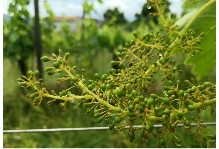
Verdicchio – mignolatura (BBCH 73)