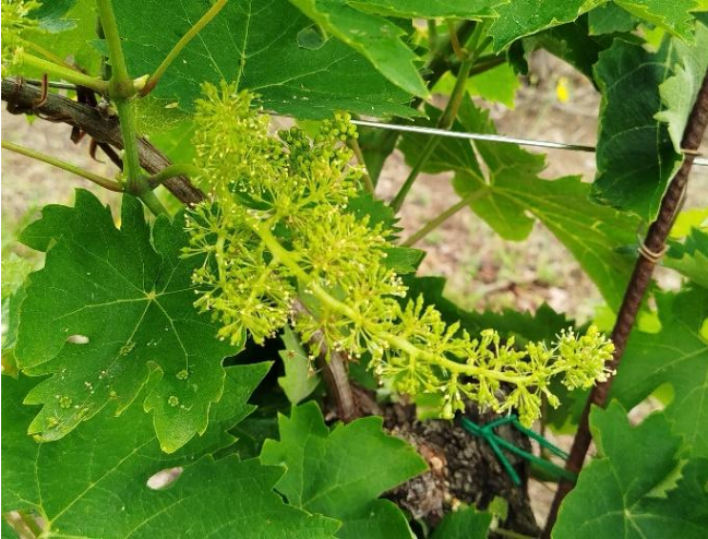
Montepulciano – allegagione (BBCH 71)

La coltura si trova generalmente nella fase fenologica di allegagione – mignolatura (BBCH 71 - 73)