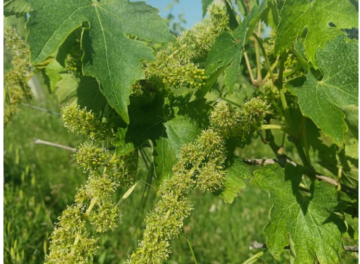
Verdicchio – Piena Fioritura

Per le aziende che adottano il metodo della difesa integrata , il trattamento consigliato nel precedente Notiziario Agrometeorologico 19/2026 garantisce adeguata protezione della coltura , pertanto al momento non è necessario alcun intervento di difesa . Ulteriori indicazioni verranno fornite con il prossimo Notiziario.