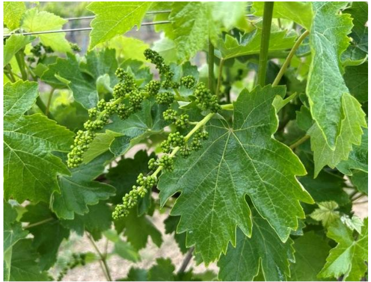
Sangiovese – Bottoni fiorali separati BBCH 57