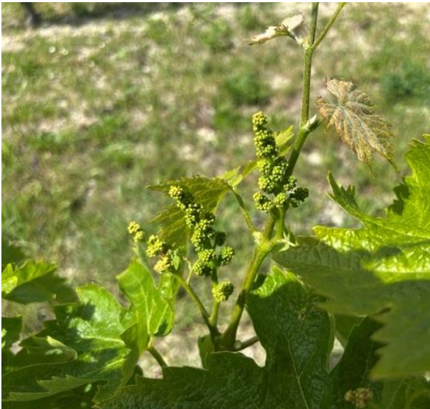
Montepulciano - grappoli separati BBCH 55

La coltura si trova generalmente nella fase fenologica fra grappoli separati e bottoni fiorali separati (BBCH 55-57).