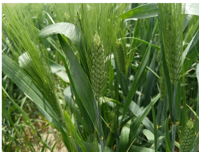
Piena fioritura BBCH 65

Si ribadisce infatti l'importanza di intervenire al raggiungimento della fase di spigatura/inizio fioritura, con un intervento preventivo per il controllo della Fusariosi della spiga per evitare il possibile sviluppo di micotossine pericolose per la salute umana. Per i prodotti da impiegare si rimanda al Notiziario precedente n. 16