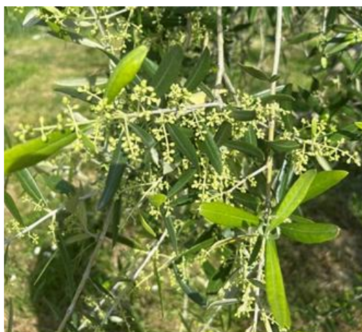
Mignolatura BBCH 55

Esclusivamente nelle aziende a conduzione biologica , si consiglia, dopo le piogge dei prossimi giorni, e comunque entro sabato 9, di effettuare un trattamento sulla generazione antofaga, con Bacillus thuringiensis (☘) o, in alternativa, con Silicato di alluminio (caolino calcinato) (☘), seguendo le indicazioni riportate in etichetta.