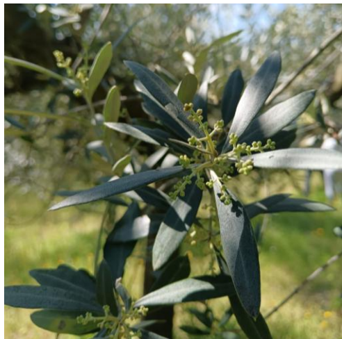
Mignolatura BBCH 54

La fase fenologica dell'olivo è nella fase prossima alla mignolatura BBCH 54 .