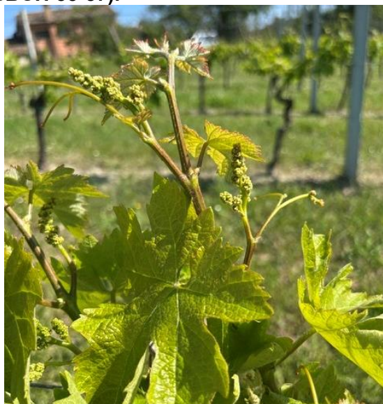
Montepulciano - grappoli separati BBCH 55

La coltura si trova generalmente nella fase fenologica fra grappoli separati e bottoni fiorali separati (BBCH 55-57) .