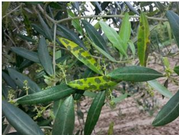
Occhio di pavone

In diversi oliveti, in particolare sulle cultivar più suscettibili, si riscontra presenza di Occhio di pavone ; per il controllo di tale patogeno è stato indicato l'intervento a base di prodotti rameici (♣) al termine delle operazioni di potatura, per la difesa della nuova vegetazione, qualora non fosse stato eseguito si consiglia, vista la fase fenologica, di eseguirlo tempestivamente.