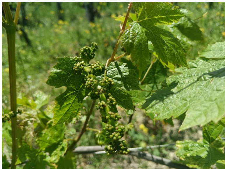
Verdicchio – Bottoni fiorali separati BBCH 57