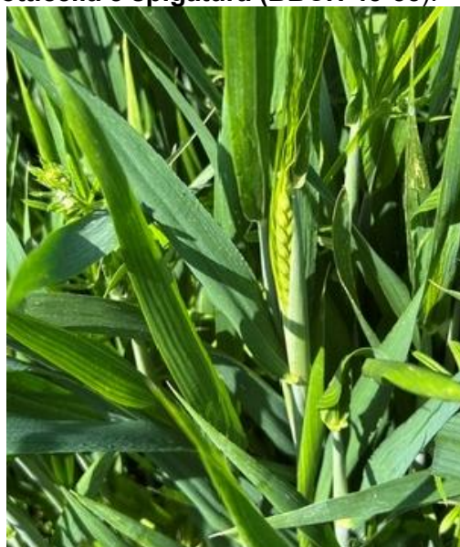
Spigatura BBCH 55

Al momento nei siti della rete di monitoraggio non si evidenziano particolari problematiche fitosanitarie, si consiglia comunque di monitorare i propri appezzamenti e nell'esecuzione del trattamento fungicida consigliato contro la Fusariosi , valutare l'impiego delle sostanze attive più idonee al controllo anche di ulteriori eventuali altre crittogame.