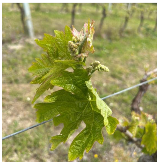
Montepulciano - grappoli visibili BBCH 53

La coltura si trova generalmente nella fase fenologica fra grappoli visibili e separati (BBCH 53-55) .