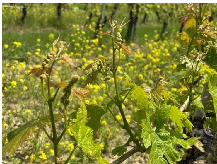
Lacrima - Grappoli Separati BBCH 55