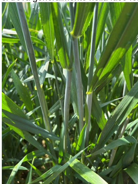
Fine Botticella BBCH 45

La coltura si trova generalmente nella fase fenologica fra botticella e spigatura (BBCH 45-55) .