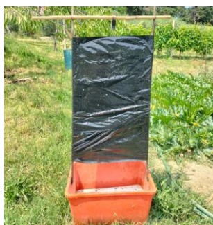
Trappola per la cattura massale tipo "totem"