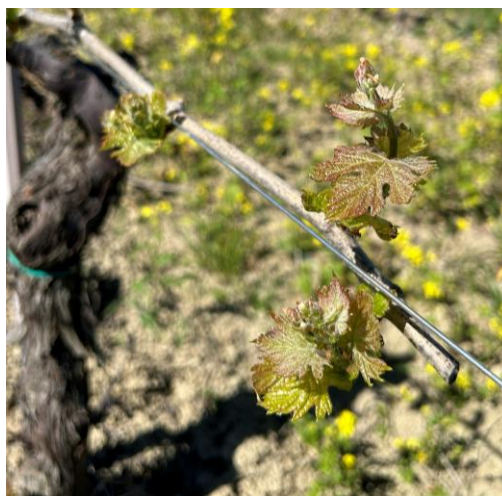
Lacrima – Grappoli visibili BBCH 53

Al momento non si segnalano particolari criticità, dal punto di vista fitosanitario. Nelle aziende a conduzione convenzionale ( difesa integrata ), limitatamente ai vigneti in cui lo scorso anno si sono registrati problemi di oidio e/o varietà suscettibili , si consiglia di effettuare un trattamento entro il fine settimana con zolfo bagnabile micronizzato (♣). L'obiettivo di tale intervento è quello di contenere l'inoculo svernante del fungo.