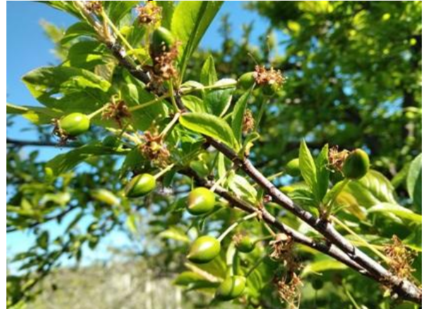
Susino: scamicatura BBCH 72