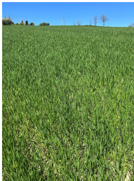
Foglia a bandiera BBCH 39