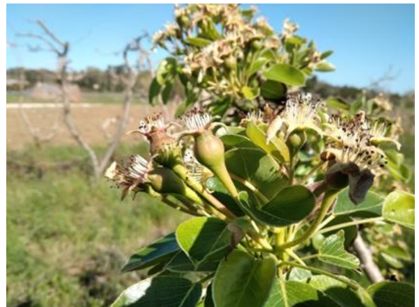
Pero: allegazione BBCH 71