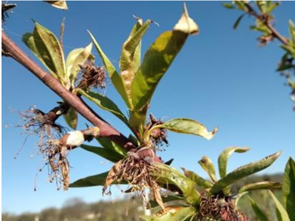
Pesco: scamicatura BBCH 72