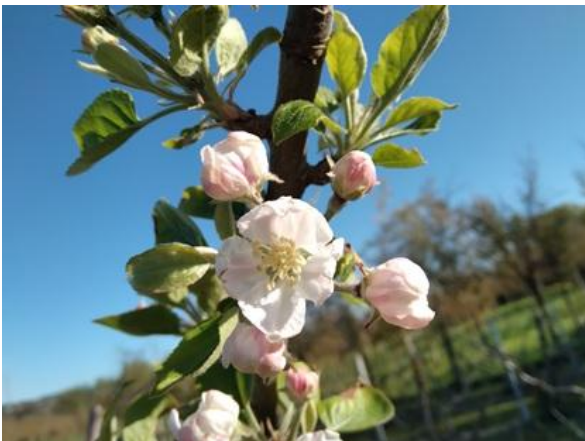
Melo: inizio fioritura BBCH 60