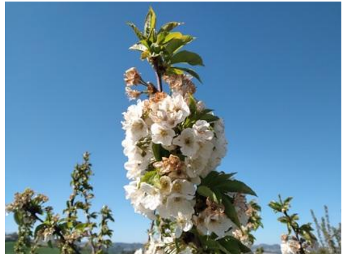
Ciliegio: fine fioritura BBCH 69