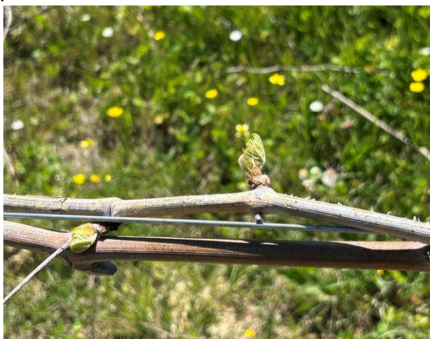
Apertura gemme BBCH 08

Si segnalano in alcuni vigneti, lievi annerimenti del bordo delle prime foglioline, effetti del vento freddo dei giorni scorsi.