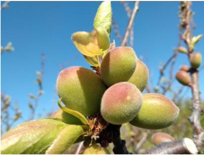
Albicocco: accrescimento frutto BBCH 74

L' albicocco si trova nella maggior parte dei casi nella fase fenologica di scamicatura- accrescimento frutti BBCH 72-74 , il susino si trova fra fine fioritura e scamicatura BBCH 69-72 , il pesco da allegazione a scamicatura BBCH 71-72 , il ciliegio è, nella maggior parte dei casi fra piena e fine fioritura BBCH 65-69 . Nelle pomacee, il melo è nella maggior parte dei casi a inizio fioritura BBCH 60 mentre il pero è da piena fioritura ad allegazione BBCH 65-71 .