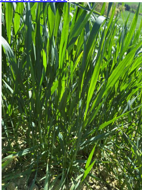
Foglia a bandiera BBCH 39

Le condizioni di instabilità delle ultime settimane hanno ritardato l'esecuzione dei diserbi, che in molti campi si stanno effettuando proprio in questi giorni. Si ricorda l'importanza di scegliere i principi attivi da utilizzare in funzione delle infestanti osservate in campo: per le specifiche indicazioni si rimanda al Notiziario Agrometeorologico 8/2026 .