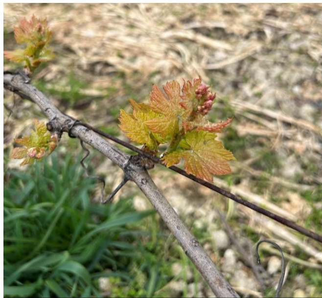
Lacrima - Foglie distese BBCH 13