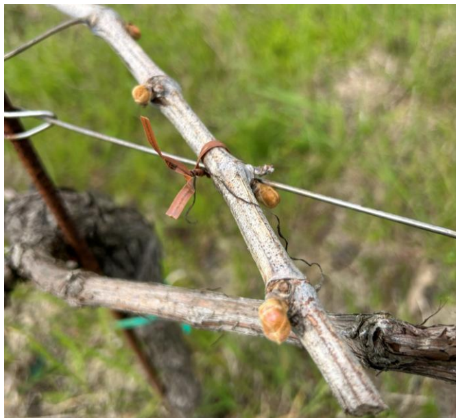
Rigonfiamento gemme BBCH 01

La fase fenologica della vite è compresa fra rigonfiamento gemme e foglie distese (solo per le varietà più precoci come la Lacrima) BBCH 01-13 . Al momento non si consiglia alcun intervento.