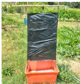
Trappola per la cattura massale tipo "totem"