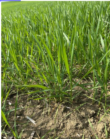
Frumento duro: inizio levata BBCH 30

Negli appezzamenti dove la coltura è nelle fasi più avanzate e dove è stata eseguita la prima concimazione azotata già da qualche tempo, a meno che non siano stati impiegati concimi a lento rilascio distribuiti in un unico passaggio, si ritiene opportuno ricordare che ad inizio levata è necessario almeno un secondo intervento con fertilizzanti azotati, per le indicazioni sulle necessità e quantità da distribuire si rimanda alle indicazioni del Notiziario 4/2026