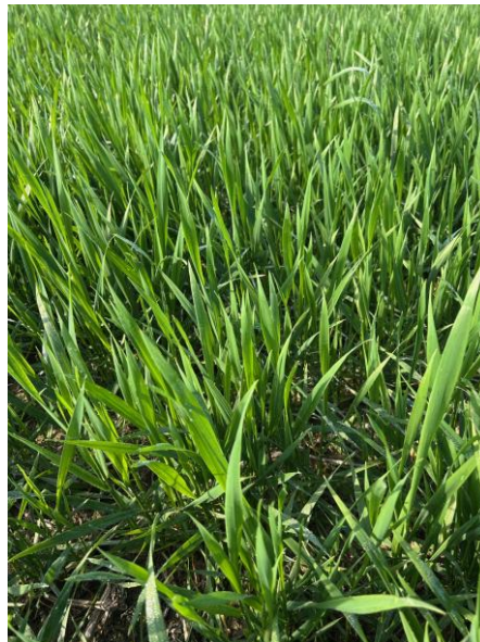
Frumento duro: primo nodo BBCH 31