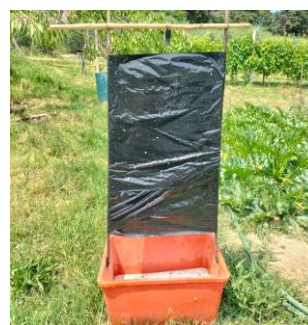
Trappola per la cattura massale tipo "totem"