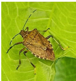
Adulto di cimice asiatica