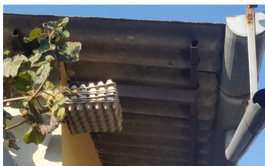
Trappola per la cattura massale tipo "cartone delle uova"