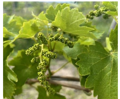
Verdeccchio – bottoni fiorali separati BBCH 57

Visto quindi il rapido sviluppo di nuova vegetazione (scoperta dai trattamenti di difesa), le condizioni di piogge con frequenza quasi giornaliera ed intensità molto variabile sul territorio, è necessario porre la massima cautela nella gestione della difesa del vigneto ,