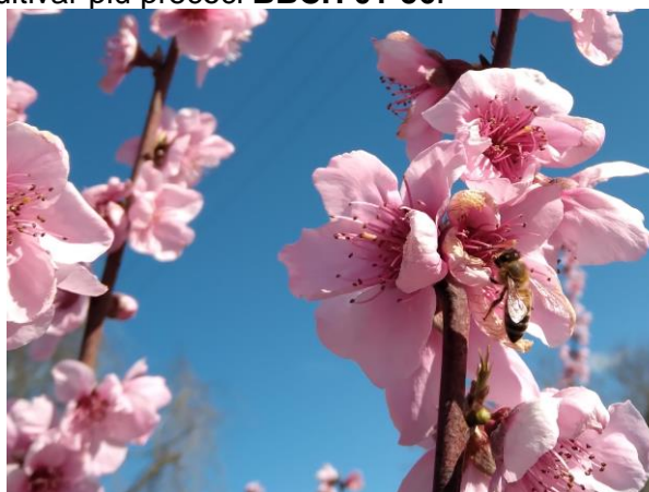
Pesco in piena fioritura BBCH 65

L' albicocco è nella maggior parte dei casi nella fase fenologica compresa fra piena fioritura e fine caduta petali BBCH 65-69 , il susino manifesta la maggiore variabilità e va da boccioli visibili a piena fioritura BBCH 55-65 , il pesco fra inizio fioritura a fine fioritura BBCH 60-69 , il ciliegio è nella fase di rigonfiamento gemme BBCH 01 . Il melo si trova ancora a gemma dormiente BBCH 00 mentre il pero è fra rigonfiamento gemma e bottoni verdi nelle cultivar più precoci BBCH 01-56 .