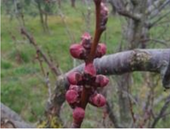
Albicocco: bottone rosso BBCH 55

La quasi totalità delle cultivar di melo sono ancora a gemma dormiente BBCH 00 , mentre il pero si trova fra gemma dormiente e rigonfiamento gemma BBCH 00-01