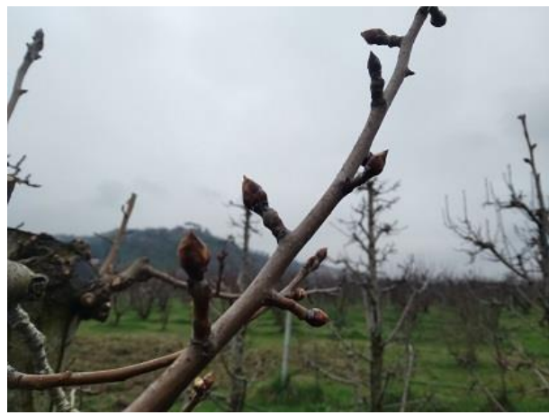
Pero: rigonfiamento gemme BBCH 01

Nella fase di prefioritura è molto importante procedere con trattamenti preventivi contro alcune delle avversità principali dei fruttiferi, diverse cultivar hanno ormai raggiunto questa fase, anche se è piuttosto evidente una certa scolarità fra le diverse cultivar dove quelle più tardive sono ancora nelle fasi più arretrate; sporadicamente è possibile notare alcune piante di pesco o susino già in fioritura, in questi casi si raccomanda di verificare la sanità delle piante, in genere si tratta di alberi parzialmente compromessi.