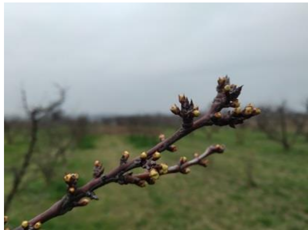
Susino: boccioli visibili BBCH 55