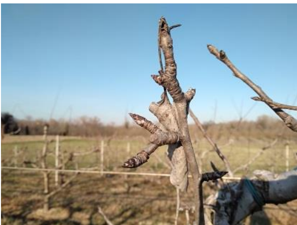
Melo: gemma dormiente BBCH 00