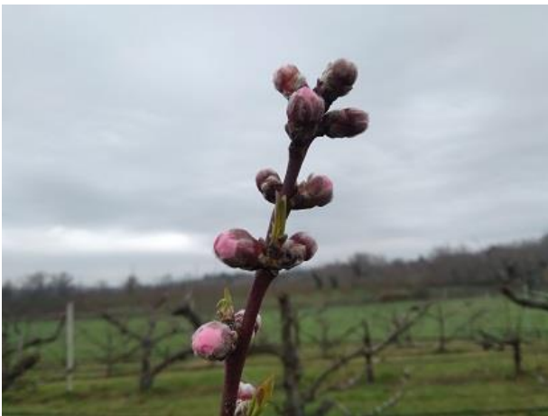
Pesco: inizio bottoni rosa BBCH 57