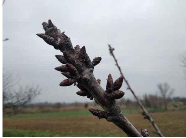
Ciliegio: inizio rigonfiamento gemme BBCH 01