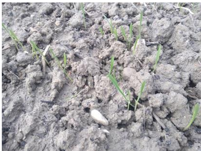
Frumento duro: una foglia BBCH 11

La fase fenologica dei cereali autunno vernini è nella maggior parte dei siti compresa fra le fasi di una-due foglie per quelli seminati più tardivamente e accestimento BBCH 11-22 .