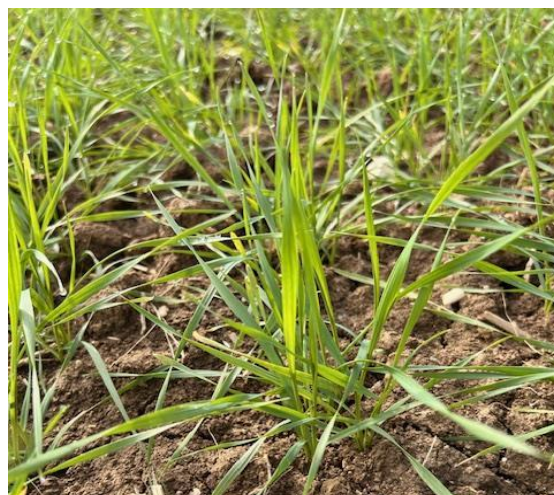
Frumento duro: inizio accestimento BBCH 21

Si notano ancora alcuni appezzamenti con ingiallimenti diffusi, ma anche grazie alle concimazioni azotate che sono in corso di distribuzione o che verranno effettuate nei prossimi giorni, la coltura dovrebbe riprendersi senza grandi difficoltà, per informazioni sulla distribuzione di fertilizzanti azotati si rimanda al precedente Notiziario n. 4/2025 .