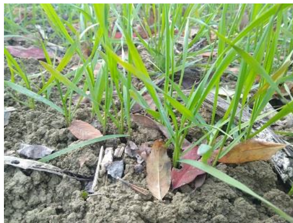
Frumento duro: inizio accestimento BBCH 21