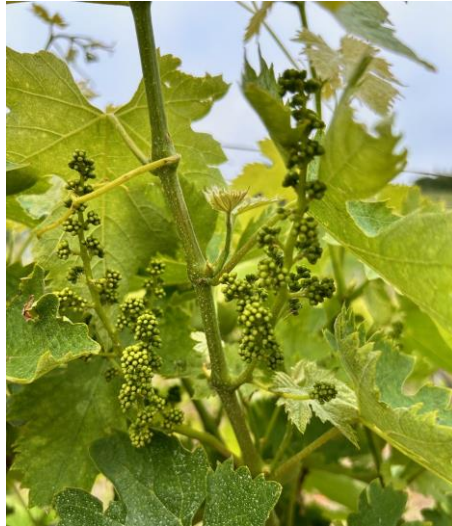
Verdicchio – bottoni fiorali separati BBCH 57

La fase fenologica della vite è nella maggior parte dei casi a bottoni fiorali separati BBCH 57 ed in alcuni casi ad inizio fioritura per le varietà più precoci BBCH 61 .