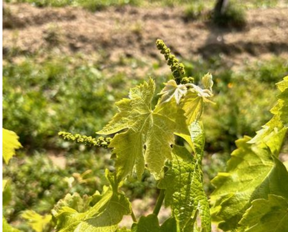
Verdicchio - grappoli separati BBCH 55

Rimangono evidenti in diversi areali, perlopiù a carico dell'apparato fogliare, i danni delle grandinate che hanno coinvolto il nostro territorio per la perturbazione del 18 aprile.