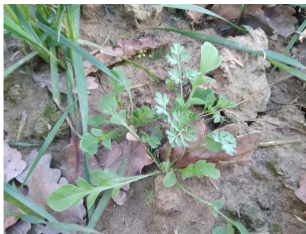
Infestanti su grano duro già sviluppate

Nelle tabelle che seguono si riportano le sostanze attive presenti nelle: “Linee Guida per la Produzione Integrata delle colture, Difesa Fitosanitaria e Controllo delle Infestanti” della Regione Marche 2021021 http://www.meteo.marche.it/news/2021/LineeGuidaPI_2021_estiva.pdf . (Ultima versione approvata).