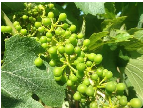
Mignolatura BBCH 73

Nella quasi totalità dei vigneti la coltura manifesta un elevato rigoglio vegetativo, sono in corso le necessarie operazioni di gestione della chioma, in particolare si consiglia di procedere con la sfogliatura e palizzata ed anche all'eliminazione dei polloni. La corretta gestione della vegetazione costituisce un requisito fondamentale sia per uno sviluppo equilibrato della pianta, sia per garantire una migliore efficacia dei trattamenti di difesa ed anche al fine di evitare danni ai tralci durante il passaggio dei mezzi agricoli.