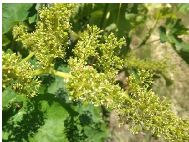
Fine fioritura BBCH 69

La vite si trova fra la fase fenologica di fine fioritura a mignolatura BBCH 69-73 .