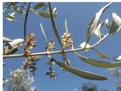
Olivo: allegagione BBCH 69

Per quanto riguarda il monitoraggio della Mosca dell'olivo ( Bactrocera oleae ), questo centro ha provveduto ad iniziare il monitoraggio e dai prossimi notiziari fornirà indicazioni sulla difesa. Per le aziende che intendono effettuare in proprio il rilevamento della presenza del fitofago , si consiglia di provvedere all'acquisto e all'installazione delle apposite trappole di monitoraggio (♣).