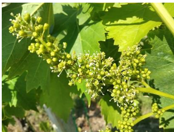
Piena fioritura BBCH 65

Al momento la coltura è in generale, nella quasi totalità dei vigneti, in ottime condizioni vegetative senza particolari problematiche fitosanitarie; solo in maniera sporadica ed occasionale, in alcune aziende a conduzione biologica, si sono rinvenuti attacchi di peronospora sia su foglia sia su grappolo, con sporificazione in atto e quindi con il rischio della partenza di infezioni secondarie.