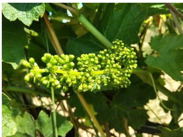
Bottoni fiorali separati BBCH 57

Favorita dalle condizioni meteorologiche caratterizzate da abbondante disponibilità idrica e temperature miti del periodo, la vite è in rapido accrescimento e si trova fra la fase fenologica di bottoni fiorali separati e piena fioritura BBCH 57-65 .