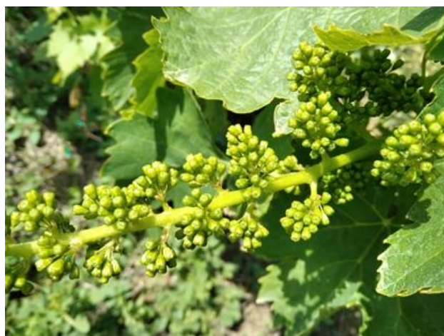
Sangiovese – bottoni fiorali separati BBCH 57