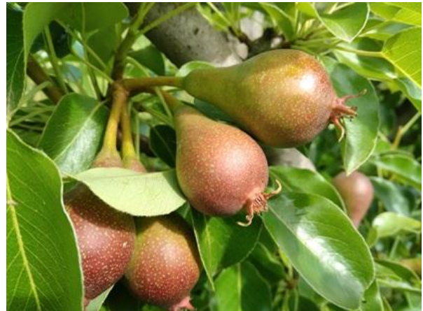
Pero: frutto noce BBCH 73