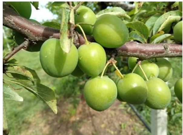
Susino: accrescimento frutti BBCH 78