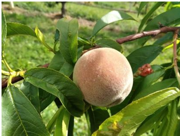
Pesco: accrescimento frutti BBCH 74