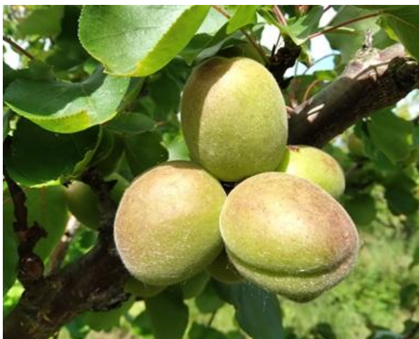
Albicocco: accrescimento frutto BBCH 79

Nelle pomacee, il melo è nella maggior parte dei casi a frutto noce BBCH 73 così come il pero è a frutto noce BBCH 73 .