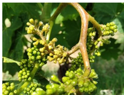
Presenza di Peronospora su grappolo

In alcuni vigneti si rileva la presenza di sintomi di peronospora, sia su foglia ed in qualche sporadico caso anche su grappolo, per cui si raccomanda la massima attenzione nella gestione della difesa , vista anche la delicata fase fenologica della vite.