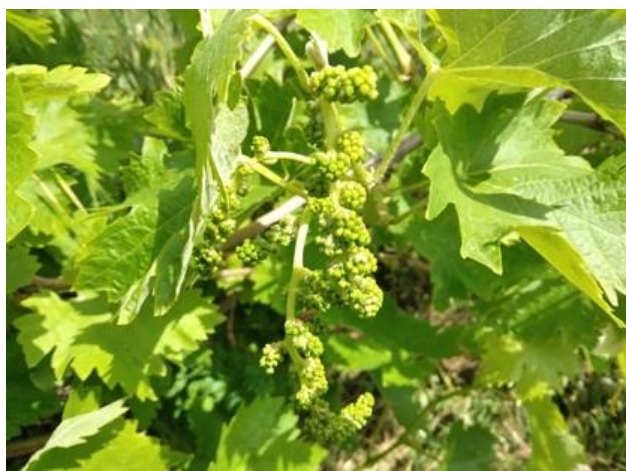
Bianchello - grappoli separati BBCH 55

La coltura si trova generalmente nella fase fenologica compresa fra grappoli separati e bottoni fiorali separati BBCH 55-57 , in alcuni vitigni più precoci ed esposti a sud, ma ancora molto sporadici e in maniera isolata, si riscontrano i primi fiori aperti.