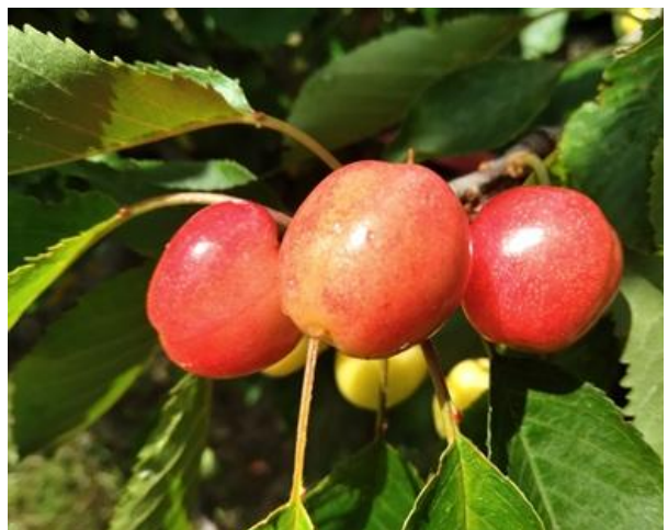
Ciliegio: accrescimento frutti BBCH 76