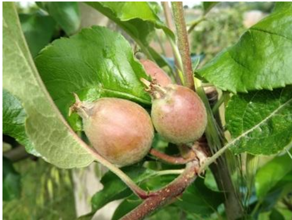
Melo: frutto noce BBCH 73