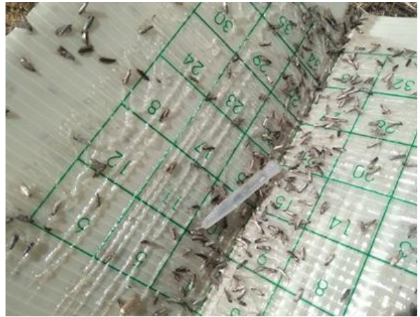
Adulti di Tignola dell'olivo su trappola

Dai monitoraggi effettuati nelle aziende della rete si rileva ancora il volo della Tignola dell'olivo ( Prays oleae ) con catture di diverse centinaia di individui/trappola.