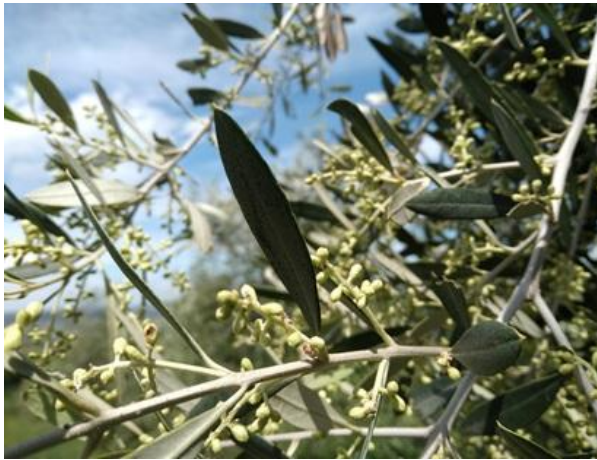
Mignolatura BBCH 54

La fase fenologica dell'olivo è quella di mignolatura BBCH 54 .