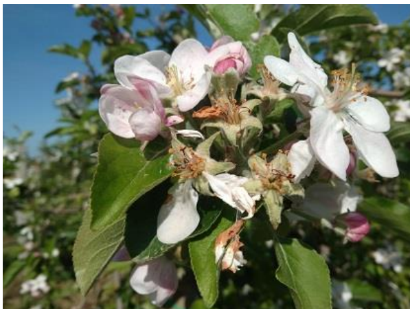
Melo: fine fioritura BBCH 69

Il melo si trova nella fase di fine fioritura BBCH 69 mentre il pero è fra allegagione e inizio accrescimento frutti BBCH 71-72 .