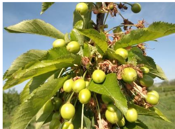
Ciliegio: accrescimento frutti BBCH 76

Il melo si trova nella fase di fine fioritura BBCH 69 mentre il pero è fra allegagione e inizio accrescimento frutti BBCH 71-72 .