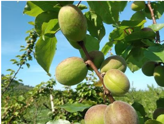
Albicocco: accrescimento frutti BBCH 76

Le drupacee: albicocco, pesco, susino e ciliegio sono nella maggior parte dei casi nella fase fenologica di inizio accrescimento frutti BBCH 74-76 .