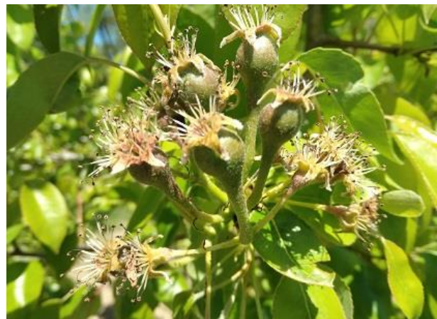
Pero: inizio accrescimento frutti BBCH 72