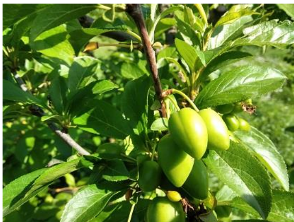
Susino: accrescimento frutti BBCH 74