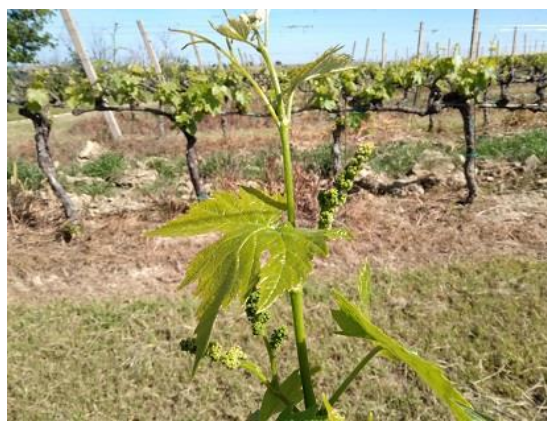
Vite: Da grappoli visibili a grappoli separati BBCH 53-55

La vite, è in rapido accrescimento ed ha raggiunto la fase fenologica compresa fra grappoli visibili e grappoli separati BBCH 53-55 .