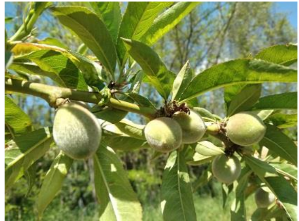
Pesco: accrescimento frutti BBCH 74