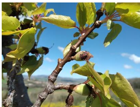
Albicocco: scamicatura BBCH 72