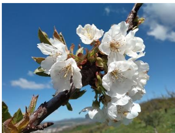
Ciliegio: piena fioritura BBCH 65

Nei fruttiferi resta ancora marcata la differenza fra le fasi fenologiche raggiunte fra le diverse cultivar. Per quanto riguarda le drupacee il pesco va dalla fase di fine caduta petali a scamicatura BBCH 69-72 , il susino va da inizio fioritura fino a scamicatura BBCH 60-72 , l' albicocco è nella maggior parte dei casi nella fase fenologica compresa fra allegagione e scamicatura BBCH 71-72 e il ciliegio è fra la fase di inizio fioritura e fine fioritura BBCH 60-69 .