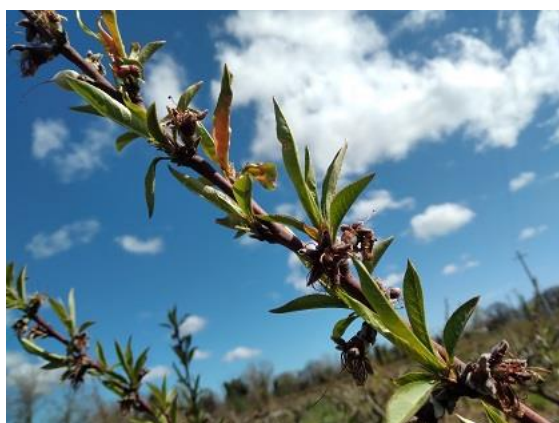
Pesco: fine caduta petali BBCH 69