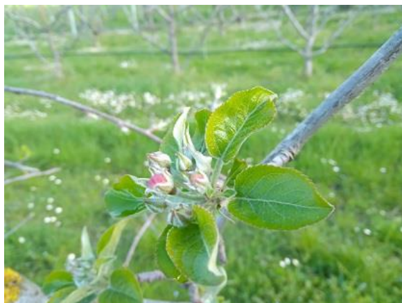
Melo: mazzetti divaricati BBCH 59