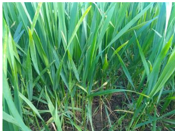
Fruento duro: Da 1° nodo a 3° nodo BBCH 31-33