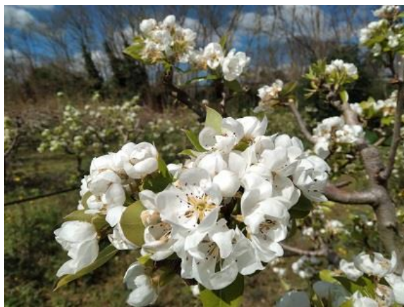
Pero: piena fioritura BBCH 65

In queste fasi, considerando anche l'andamento meteorologico, particolarmente favorevole, sono di fondamentale importanza i trattamenti per il controllo della Ticchiolatura nelle pomacee e per la Monilia delle drupacee . (indicazioni fornite nel Notiziario 11/2025 ). Si segnalano alcune situazioni, in particolare su alcune cultivar di pesco più suscettibili, con presenza di Bolla del pesco , per la difesa si rimanda al Notiziario 5/2025 .