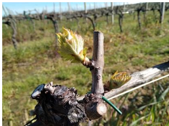
Vite: Da gemma cotonosa ad punte verdi BBCH 05-08