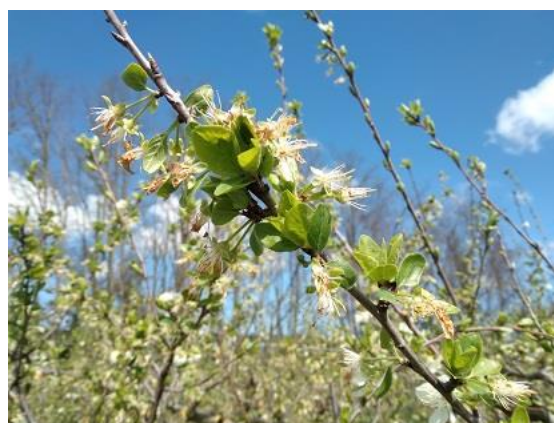
Susino: fine caduta petali BBCH 69

Per le pomacee il melo si trova nella fase di mazzetti divaricati BBCH 59 mentre la fase fenologica del pero è fra inizio e piena fioritura BBCH 60-65 .