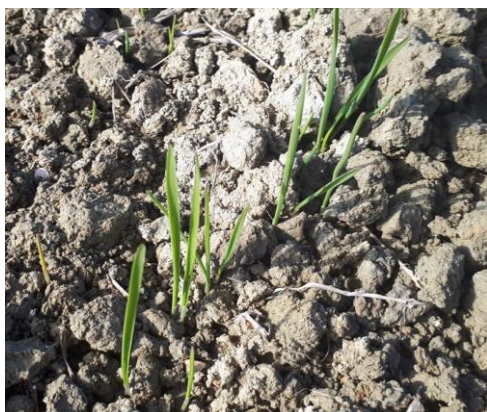
Frumento duro BCCH 11

Le neviccate e gli abbassamenti termici dell'ultimo periodo hanno rallentato lo sviluppo della coltura, attualmente non si riscontrano criticità particolari, pertanto non si consiglia nessun tipo di intervento.