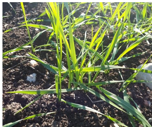
Frumento duro BBCH 21

Tutti i principi attivi indicati nel Notiziario sono previsti nelle Linee Guida per la Produzione Integrata delle Colture, "Difesa Fitosanitaria e Controllo delle Infestanti" della Regione Marche - 2018 ciascuno con le rispettive limitazioni d'uso, per la consultazione completa del documento: http://www.meteo.marche.it/news/LineeGuidaPI_DifesaFito_2018_estiva.pdf e pertanto il loro utilizzo risulta conforme con i principi della difesa integrata volontaria .