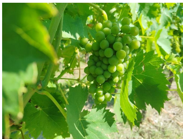
Sangiovese – chiusura grappolo (BBCH 79)