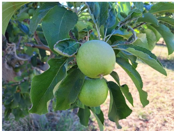
Melo - sviluppo frutti (BBCH 76)

DRUPACEE: al momento non sono necessari ulteriori interventi.