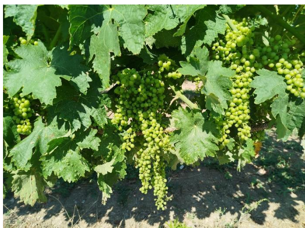
Trebbiano - chiusura grappolo (BBCH 79)

La coltura si trova generalmente nella fase fenologica di prechiusura – chiusura grappolo (BBCH 77 - 79)