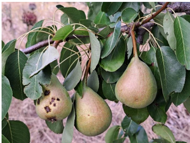
Pero - inizio invaiatura (BBCH 81)