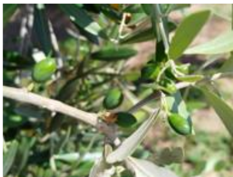
Olivo: accrescimento frutti BBCH 71

Dal monitoraggio delle trappole della rete di monitoraggio, si rilevano limitate catture di adulti di mosca dell'olivo , al momento non sono necessari trattamenti specifici, ulteriori indicazioni verranno fornite nei prossimi Notiziari.