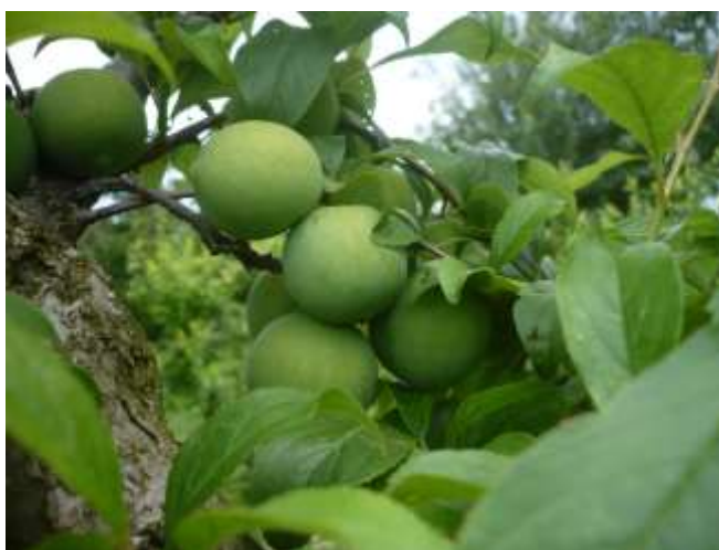
Susino – accrescimento frutti BBCH 76