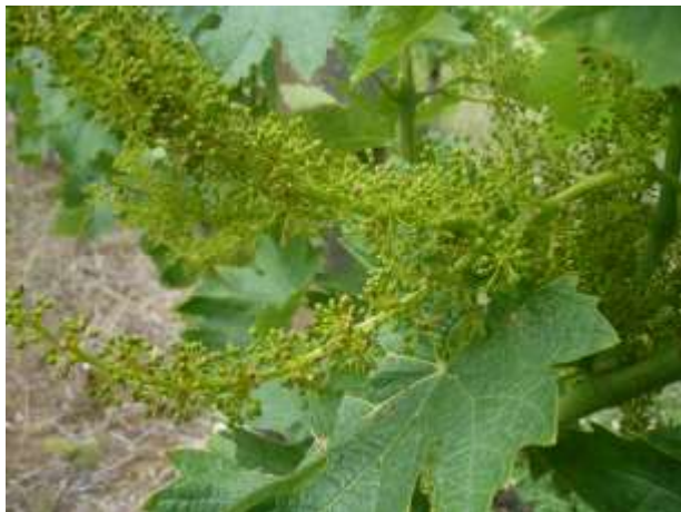
Trebbiano – fine fioritura BBCH 69

La fase fenologica della vite è generalmente compresa (in funzione della varietà, della località e dell'esposizione) tra fine fioritura e mignolatura (BBCH 69 - 73) .