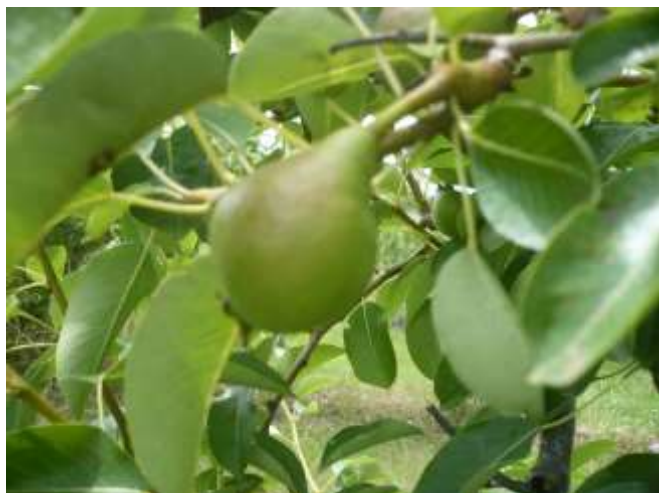
Pero - accrescimento frutti BBCH 74