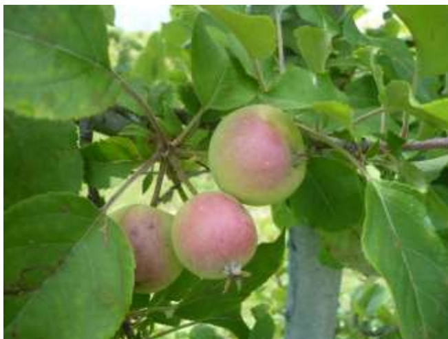
Melo – accrescimento frutti BBCH 74