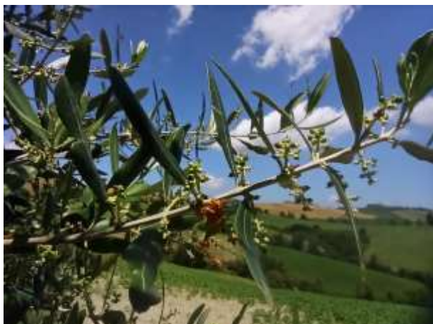
Olivo – allegagione BBCH 69

L'olivo ha generalmente raggiunto la fase fenologica di allegagione (BBCH 69) .