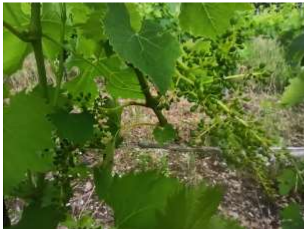
Sangiovese – mignolatura BBCH 73