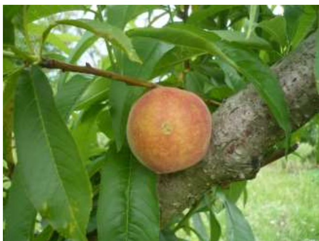
Pesco - inizio invaiatura BBCH 81

PERO Fase Fenologica: accrescimento frutto (BBCH 74 - 75)