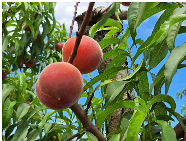
Pesco - maturazione (BBCH 85)