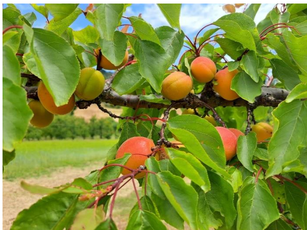
Albicocco - maturazione (BBCH 87)