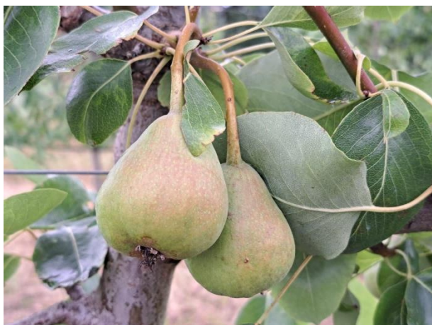
Pero - sviluppo frutti (BBCH 74)