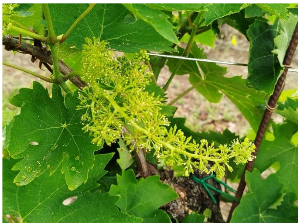
Montepulciano – allegagione (BBCH 71)

La coltura si trova generalmente nella fase fenologica di allegagione – mignolatura (BBCH 71 - 73)