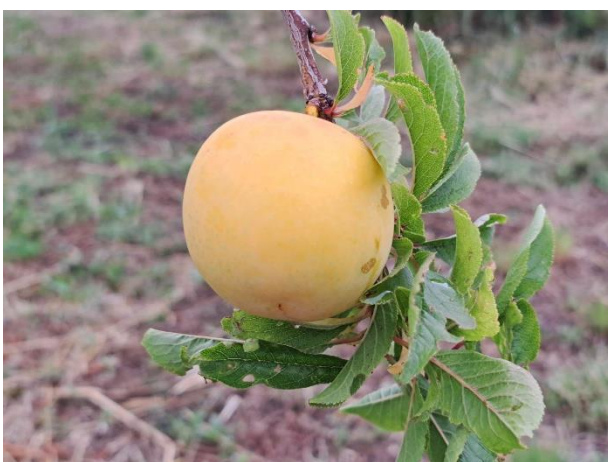
Susino - maturazione (BBCH 85)