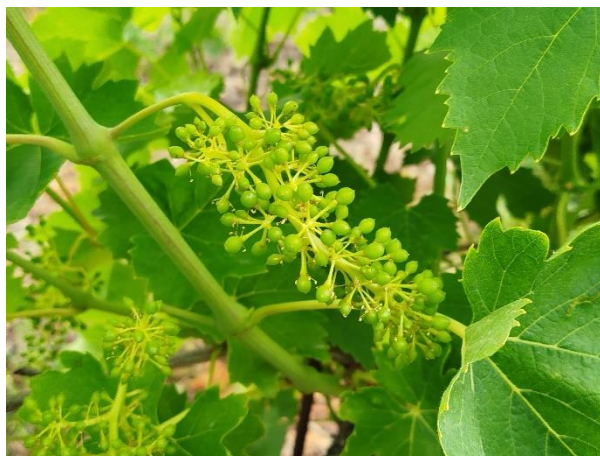
Sangiovese – mignolatura (BBCH 73)