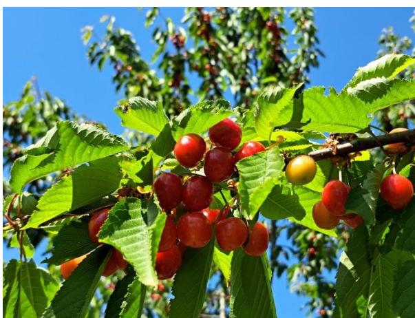
Ciliegio - maturazione (BBCH 87)