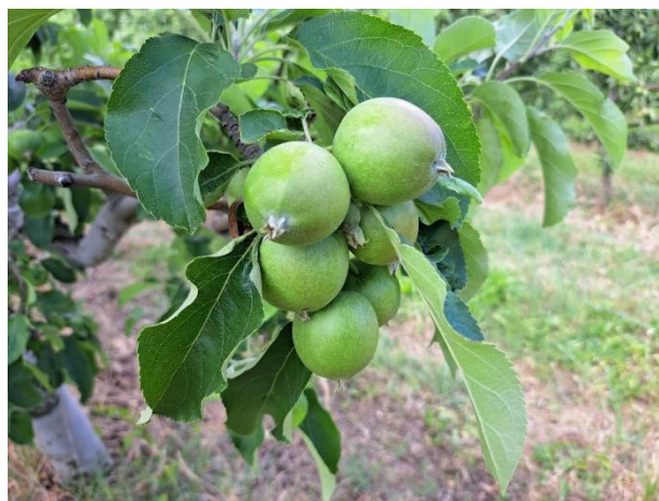
Melo - sviluppo frutti (BBCH 74)