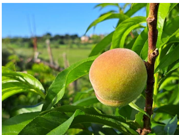
Pesco - sviluppo frutti (BBCH 75)