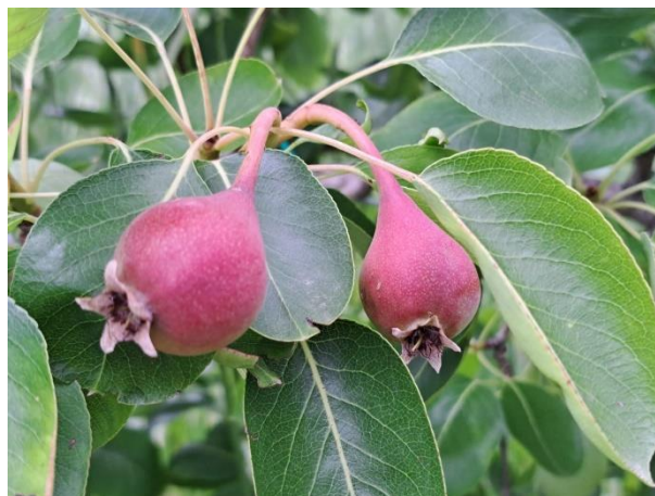
Pero - frutto noce (BBCH 73)

Pomacee: Ticchiolatura considerato l'andamento meteorologico degli ultimi giorni, raccomandiamo di tenere coperta la vegetazione, secondo le indicazioni di difesa fornite nel Notiziario