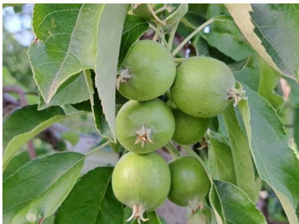
Melo - frutto noce (BBCH 73)