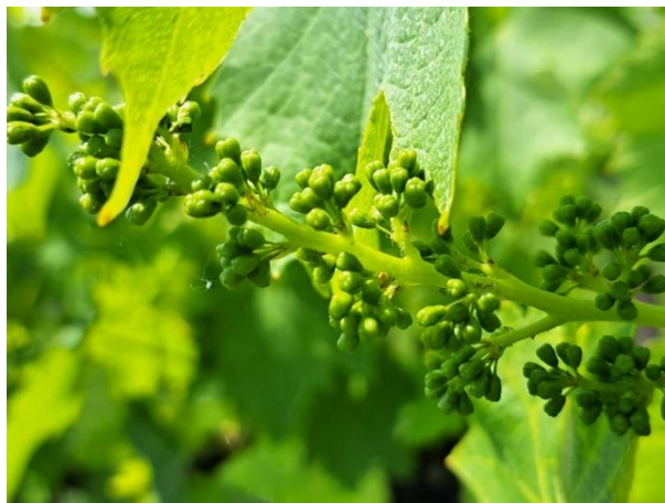
Sangiovese - bottoni fiorali separati (BBCH 57)