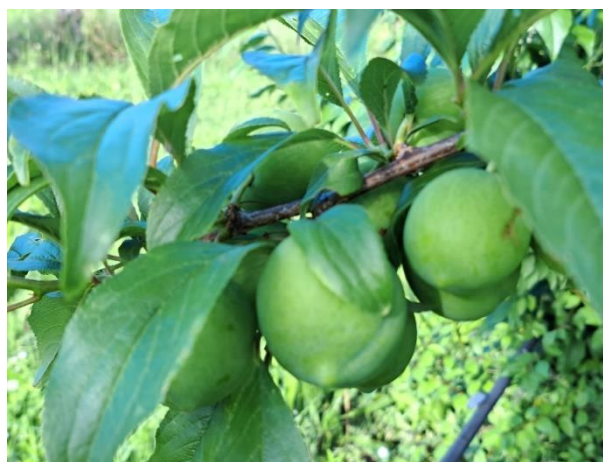
Susino - sviluppo frutti (BBCH 75)