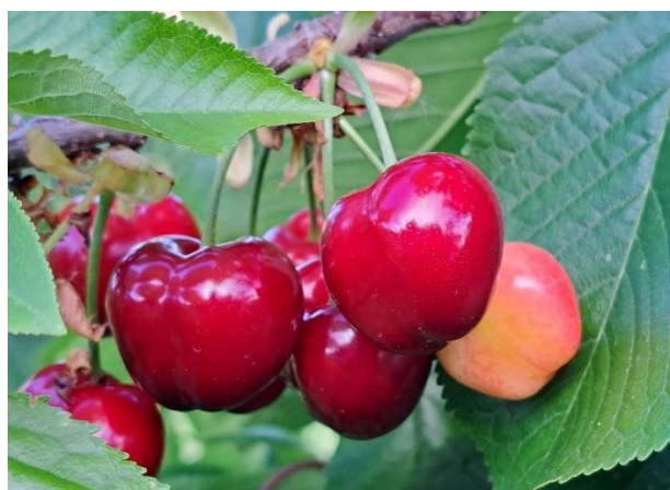
Ciliegio - maturazione (BBCH 85)