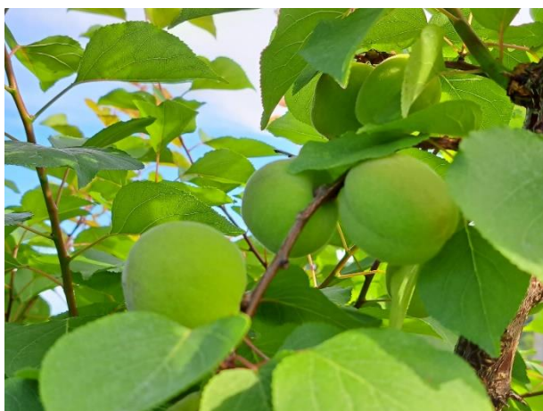
Albicocco - sviluppo frutti (BBCH 76)