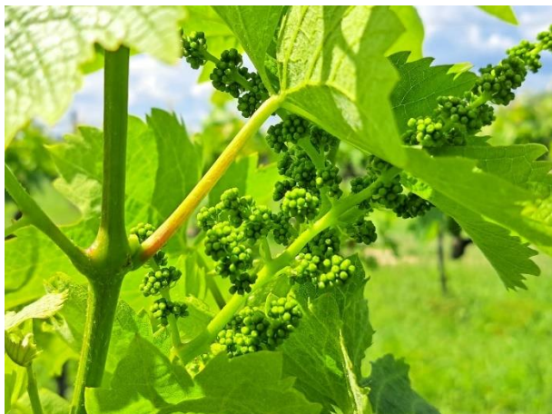
Montepulciano - bottoni fiorali separati (BBCH 57)

La coltura si trova generalmente nella fase fenologica di bottoni fiorali separati (BBCH 57)