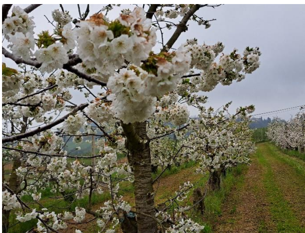
Ciliegio - piena fioritura (BBCH 65)

Considerato l'andamento meteorologico degli ultimi giorni con frequenti precipitazioni di intensità variabile, si ricorda, per le pomacee , l'importanza di tenere coperta la vegetazione contro la ticchiolatura , secondo le indicazioni di difesa fornite nel Notiziario Agrometeorologico N 11/2025 , indicazioni aggiornate sulla base delle "linee Guida per la Produzione Integrata delle Colture, Difesa Fitosanitaria e Controllo delle Infestanti" della Regione Marche - anno 2025 approvate con Decreto del Dirigente del Settore Struttura Decentrata Agricoltura di Pesaro Urbino n. 41 del 12 marzo 2025.