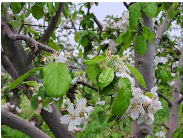
Melo - caduta petali (BBCH 67)