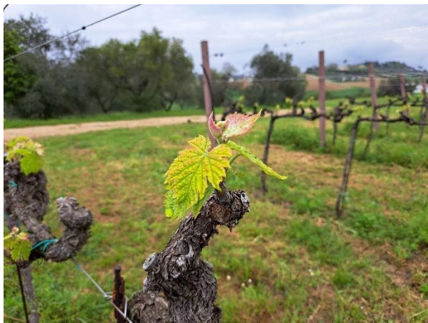
Montepulciano - prime foglie distese (BBCH 12)

Per le aziende a conduzione biologica è opportuno intervenire quanto prima e comunque entro venerdì 18 con prodotti a base di Rame (♣) + zolfo bagnabile micronizzato (♣) + eventualmente Cerevisane (♣) o COS-OGA (♣) o Laminarina .