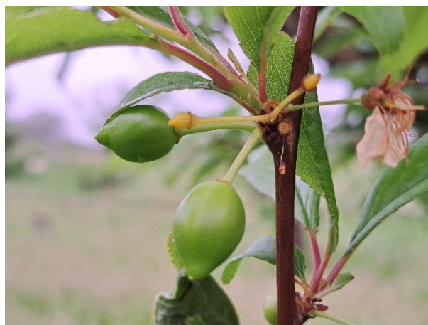
Susino - sviluppo frutti (BBCH 73)