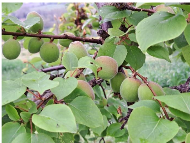
Albicocco - sviluppo frutti (BBCH 74)