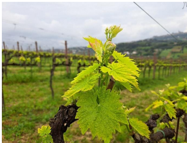
Sangiovese - grappoli visibili (BBCH 53)

Limitazioni e indicazioni di utilizzo dei prodotti consigliati sopra sono riportati nella tabella sottostante.