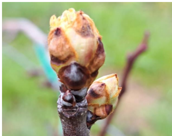
Pero – rigonfiamento gemme (BBCH 01)