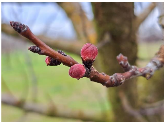
Albicocco – bottoni rossi (BBCH 55)