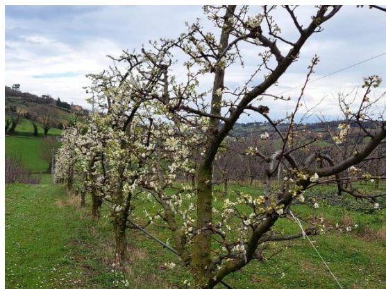
Susino – inizio fioritura (BBCH 60)