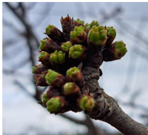
Ciliegio – rigonfiamento gemme (BBCH 01)