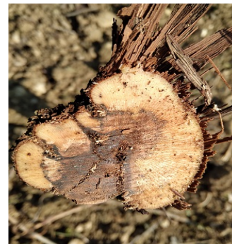
Fusto di vite colpito da carie

Il complesso del Mal dell'esca: Si tratta di un complesso di patogeni vascolari che producono fitotossine con alterazione della fisiologia della pianta e contribuiscono alla formazione dei classici sintomi fogliari. Anche gli agenti di Carie, deteriorando il legno, possono contribuire anche irreversibilmente alla riduzione del trasporto della linfa. Sintomi fogliari e Carie (vedi foto) possono essere presenti contemporaneamente nella stessa pianta.