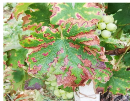
Sintomi su foglie di mal dell'esca

Che cosa fare nel vigneto per ridurre la propagazione della malattia: