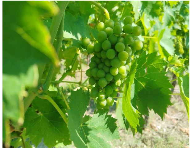
Chiusura grappolo (BBCH 79)