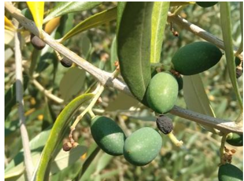
Olivo: accrescimento frutti BBCH 71

Dal monitoraggio delle trappole della rete di monitoraggio, si rilevano limitate catture di adulti di mosca dell'olivo , al momento non sono necessari trattamenti specifici, ulteriori indicazioni verranno fornite nei prossimi Notiziari.