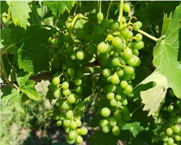
Pre chiusura grappolo (BBCH 77)

La coltura si trova generalmente nella fase fenologica di prechiusura -chiusura grappolo (BBCH 77 - 79)