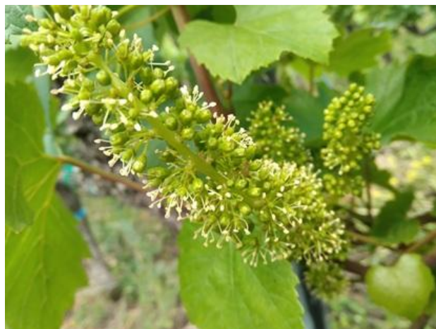
Piena fioritura BBCH 65