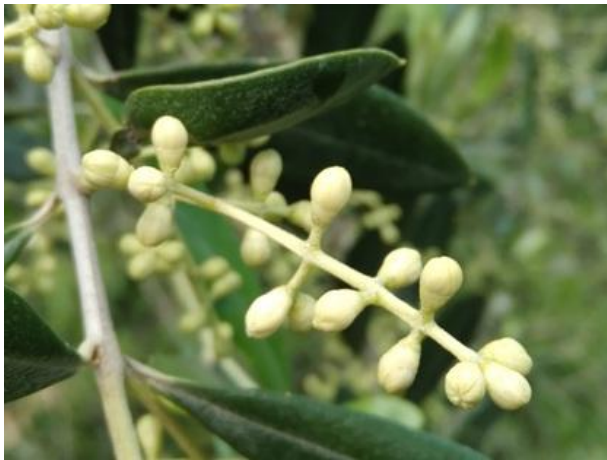
Mignolatura BBCH 59

La fase fenologica dell'olivo è quella di mignolatura-inizio fioritura BBCH 59-60 , non si segnalano criticità particolari.