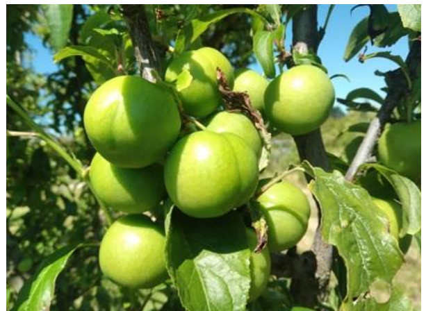
Susino: accrescimento frutti BBCH 79