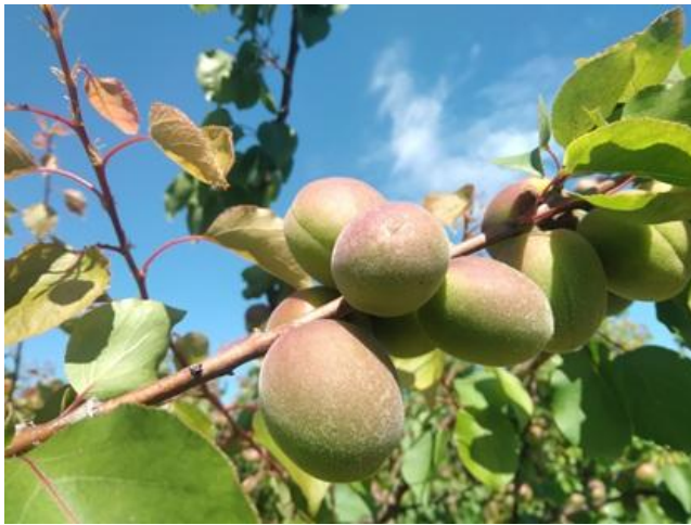
Albicocco: accrescimento frutto BBCH 79