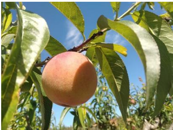
Pesco: accrescimento frutti BBCH 79