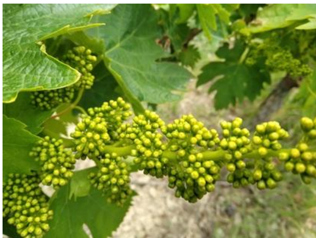
Bottoni fiorali separati BBCH 57

La coltura si trova nella fase fenologica da bottoni fiorali separati a piena fioritura BBCH 57 - 65 .