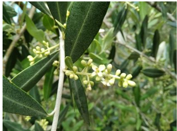
Primi fiori aperti BBCH 60