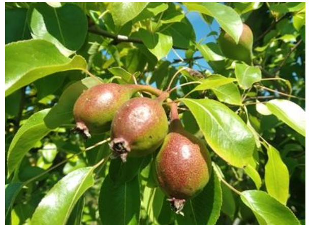
Pero: accrescimento frutto BBCH 74