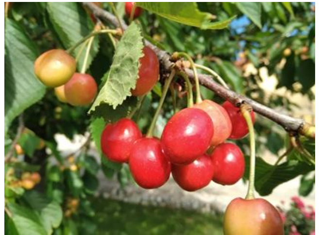
Ciliegio: invaiatura BBCH 81