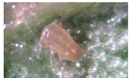
Neanide di Psilla del pero

È inoltre possibile effettuare la lotta attraverso l'utilizzo di insetti utili quali Antocoridi ( Anthocoris nemoralis ) per i quali si raccomanda di verificare la presenza in frutteto prima di effettuare i trattamenti insetticidi.