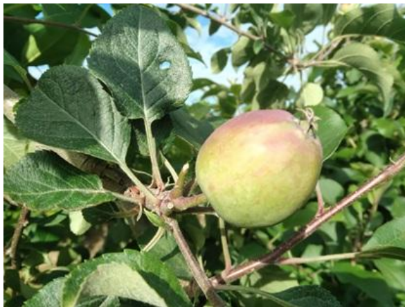
Melo: accrescimento frutto BBCH 74