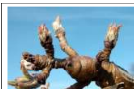
Punte verdi su melo BBCH 09

Si rileva una accentuata differenza nelle fasi fenologiche fra le cultivar, con le più precoci in una fase ben più avanzata. L' albicocco è nella maggior parte dei casi nella fase fenologica compresa fra piena fioritura e fine fioritura BBCH 65-69 , il ciliegio è a rigonfiamento gemme BBCH 01 , il susino fra rigonfiamento gemme nelle cultivar più tardive a piena fioritura in quelle più precoci BBCH 01-65 , il pesco fra bottone rosa e piena fioritura BBCH 57-65 .