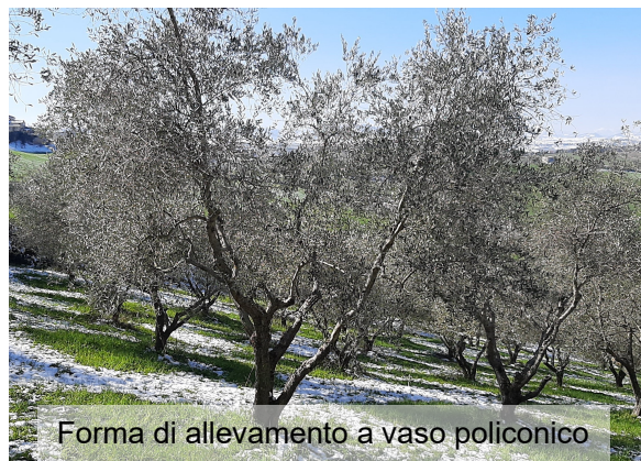
Forma di allevamento a vaso policonico

Il periodo ottimale per effettuare la potatura è quello che precede la ripresa vegetativa , gli inverni piuttosto miti favoriscono una potatura più anticipata ma occorre