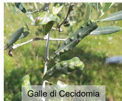
Galle di Cecidomyia

Negli oliveti dove si riscontra la presenza di Cecidomia dell'olivo ( patologia emergente nelle aree più a nord della nostra regione ), in questa fase, si consiglia di anticipare la potatura, comunque di effettuarla entro la metà di aprile, epoca del possibile inizio dello sfarfallamento, di asportare i rami maggiormente colpiti, di effettuare potature più energiche in modo da stimolare le piante più deboli e ad un ricaccio più vigoroso, si è osservato infatti che il patogeno predilige piante più deboli, effettuata l'operazione di potatura asportare le ramaglie e distruggerle mediante bruciatura.