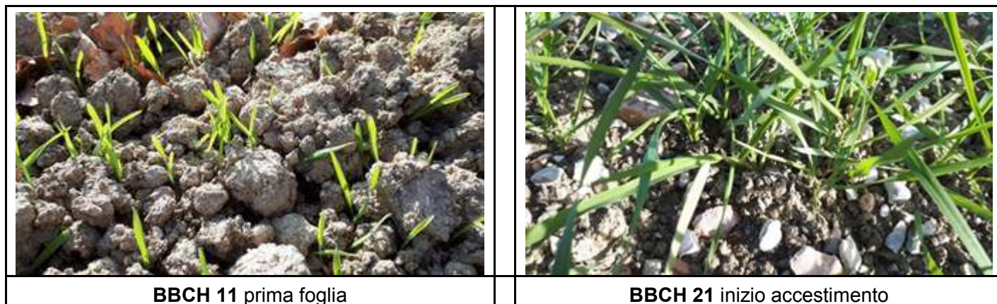
BBCH 11 prima foglia