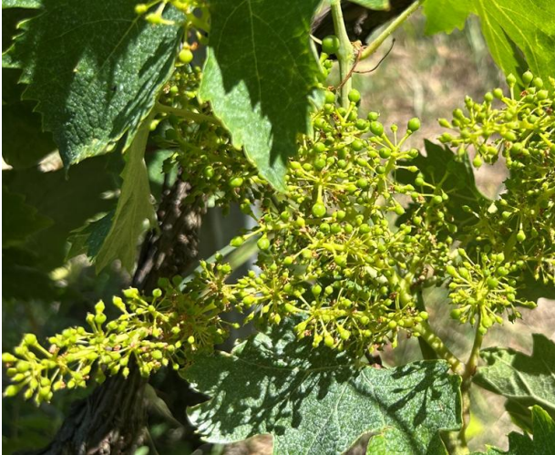
Montepulciano – mignolatura (BBCH 73)

La coltura si trova generalmente nella fase fenologica di mignolatura – sviluppo grappolo (BBCH 73-75)