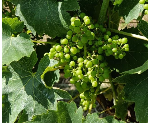
Verdicchio – sviluppo grappolo (BBCH 75)