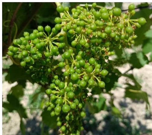
Sangiovese – mignolatura