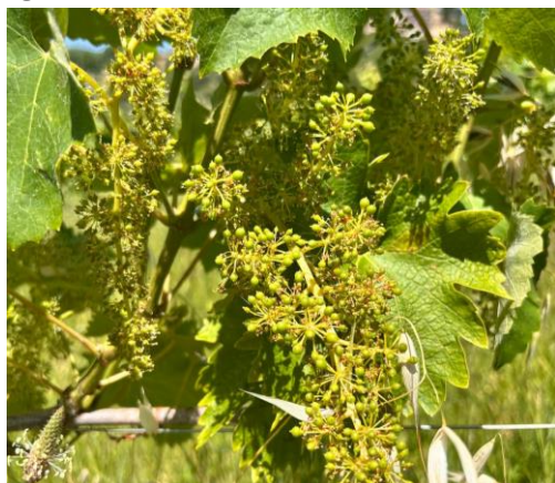
Verdicchio – allegagione

Prosegue lo sviluppo vegetativo della coltura. La vite si trova generalmente nella fase fenologica di fine fioritura e mignolatura BBCH 69-73 .