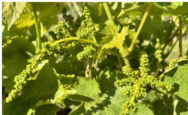
Montepulciano – bottoni fiorali separati BBCH 57

Le aziende che adottano il metodo della difesa integrata sono attualmente protette dal trattamento consigliato nel precedente Notiziario e pertanto al momento non è necessario alcun trattamento.