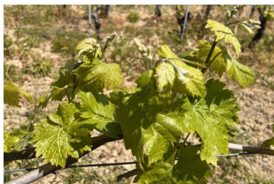
Verdicchio – grappoli distinti BBCH 55