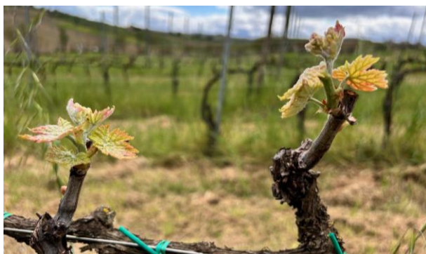
Montepulciano – grappoli visibili BBCH 53

La vite si trova generalmente nella fase fenologica fra grappoli visibili e grappoli separati (BBCH 53-55) .