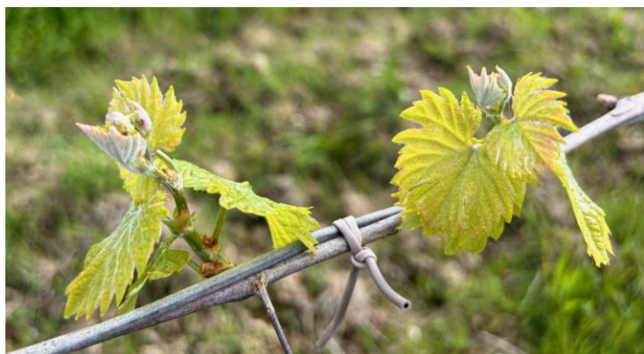
Verdicchio – foglie distese BBCH 13

La vite ha ripreso la sua attività vegetativa e si trova generalmente nella fase fenologica fra foglie distese e grappoli visibili (BBCH 12-53) .