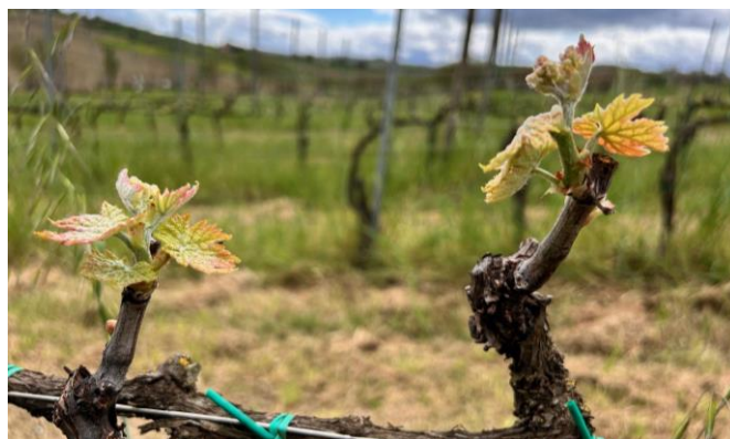
Montepulciano – grappoli visibili BBCH 53