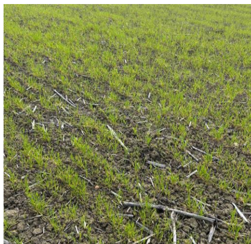
Frumento duro: ingiallimenti dovuti a carenza di azoto