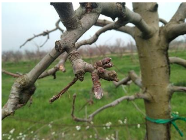
Melo: apertura gemme BBCH 07

Per quanto riguarda i trattamenti alle pomacee al momento si consiglia di intervenire sulle cultivar più precoci di pero che hanno già raggiunto la fase di orecchiette di topo con trattamenti specifici preventivi contro la Ticchiolatura , su melo si consiglia invece di attendere che la coltura sia maggiormente sviluppata e recettiva.