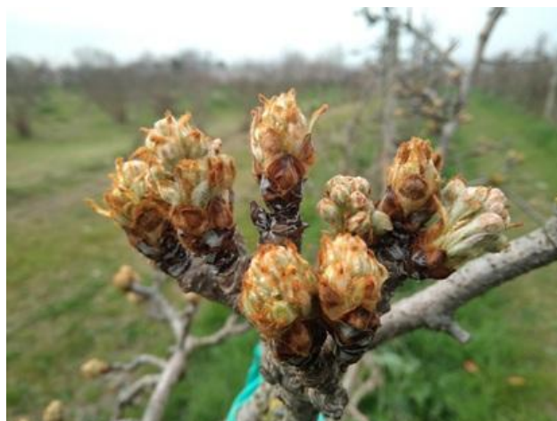
Pero: orecchiette di topo BBCH 10

Si riportano di seguito i principi attivi ammessi, dal Disciplinare Marche di difesa integrata, consigliati su pero: