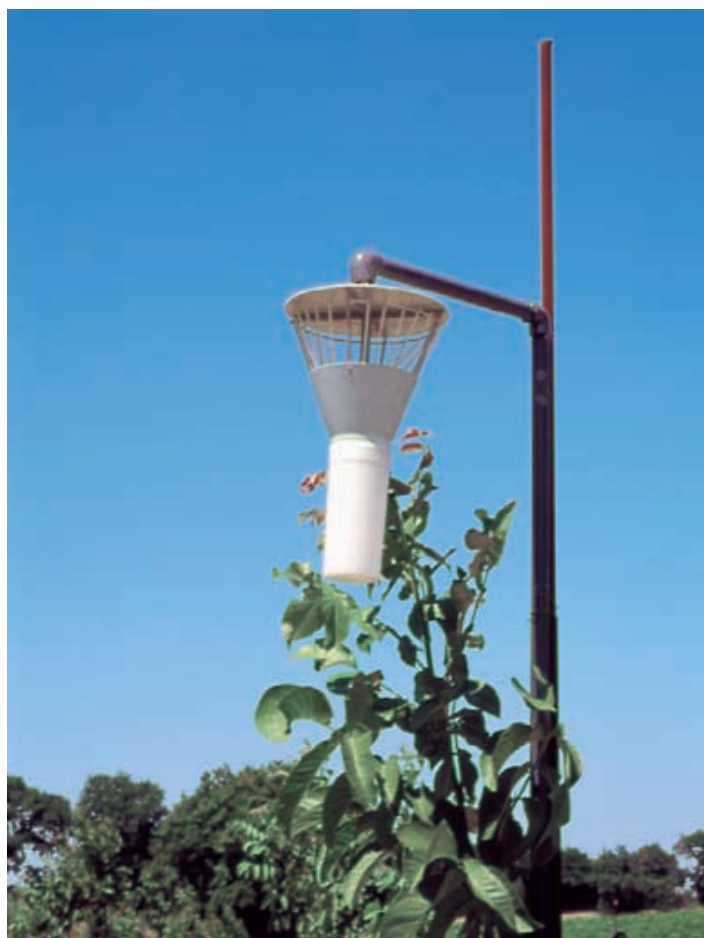
Trappola per la cattura massale

schisti adulti durante tutto il periodo di volo (maggio-agosto) in numero di 10 per ciascun ettaro. Per esprimere a pieno la loro efficacia le trappole devono essere collocate circa mezzo metro al di sopra della chioma e comunque al di fuori della vegetazione delle piante. Gli erogatori di feromone devono essere sostituiti ogni mese e periodicamente è opportuno provvedere allo svuotamento dei coni di raccolta dagli individui catturati. Recenti studi hanno evidenziato la pos-