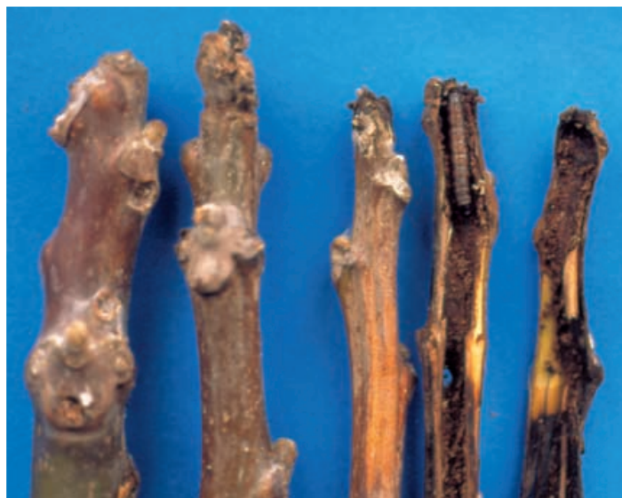
Danno alle frecce

Marche sino ad oggi non risultano attacchi a carico di questa coltura. Il danno è dovuto all'attività trofica delle larve e si distingue da quello del Cossus cossus (L.) o rodilegno rosso e di altri insetti xilofagi. L'attacco primario, causato in primavera dalle larve neonate, è a carico dei germogli che appassiscono in modo caratteristico, oppure dei giovani rametti a seguito dell'escavazione di gallerie nella zona midollare. I danni più gravi si verificano nei vivai e nei giovani impianti arborei in fase di allevamento per la perdita della freccia, cioè dell'apice vegetativo principale. I successivi stadi larvali penetrano all'interno di organi legnosi quali rami, branche e fusto scavando delle gallerie al loro interno (attacco secondario) e determinando danni consistenti soprattutto negli arboreti per la produzione di legno e nei frutteti. L'infestazione si manifesta con la presenza di fori dai quali fuoriesce una rosura tipicamente a "pellets", color ocra, che si accumula anche sul terreno in corrispondenza dei fori. Nella fase di risveglio vegetativo delle piante si assiste anche alla emissione di liquido rossastro che a contatto con l'aria imbrunisce ed imbratta la corteccia.