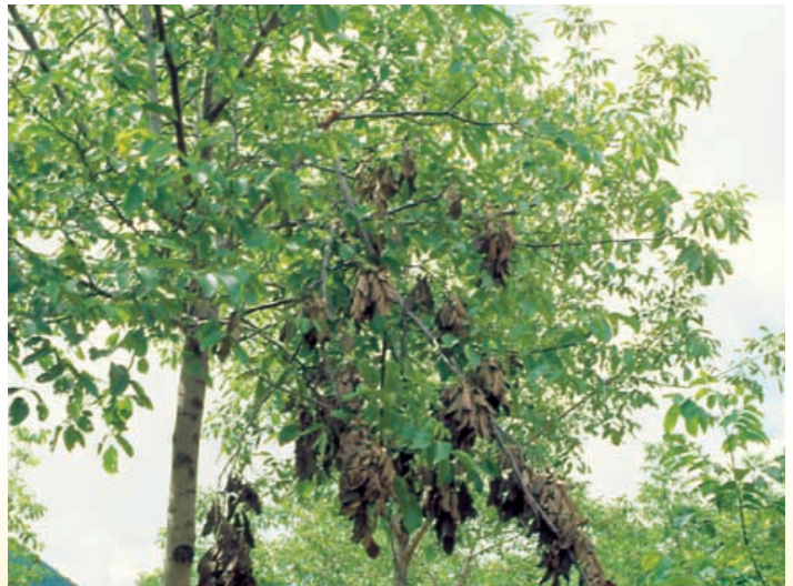
Danno alla branca