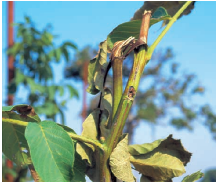
Danno al germoglio

Z. pyrina è una specie altamente polifaga ed infesta numerose essenze arboree agrarie, forestali, ornamentali e di interesse paesaggistico. Tra le specie attaccate oltre al noce sono da ricordare il melo, il pero, il cotogno, il nespolo, il platano, il faggio e l'acero. In molti comprensori italiani è stata segnalata su olivo, tuttavia nelle